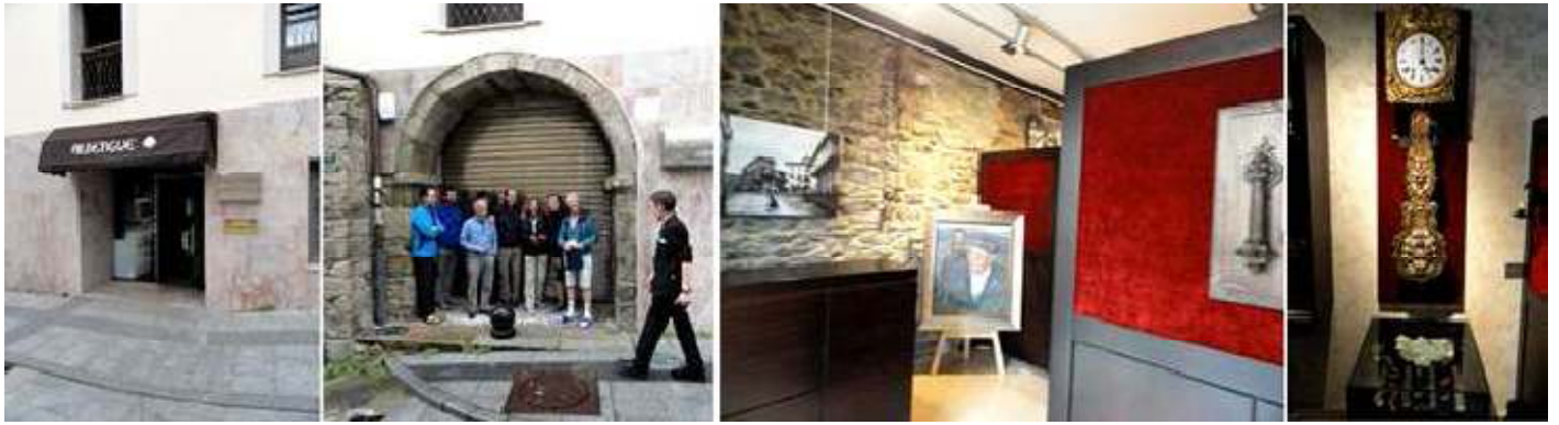
1 Puerta del Albergue en la calle lateral del palacio. 2 Entrada del Museo con un grupo de peregrinos esperando su apertura. 3 Entrada del mismo. 4 Uno de los muchos relojes expuestos.

Son piezas de la vida civil y de cuando la guerra. De lo más variado, pero destacan la colección de relojes de pared.