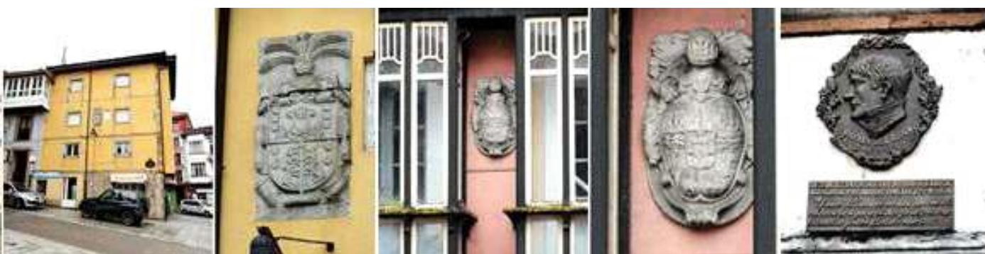
1 Casa en la plaza del Ayuntamiento. 2 Con el escudo de Bernaldo de Quirós y Tineo. El cuartel de los Tineo ostenta cinco veneras de plata. 3 Casa de Caballero Riego en la plaza del Ayuntamiento, con una vistosa galería. 4 Escudo de Caballero, con cuarteles de Sierra-Pambley, Pertierra y Flórez Valdés 5 Desde esta casa, el General de Riego, se dirigió al pueblo de Tineo el 4-10-1820. "El amor a la Patria me decidió a ..."

Concluidas las visitas, nos retiramos a cenar y posteriormente al albergue, en este palacio de Meras que tiene una zona reservada para el mismo, muy bien dotadas sus instalaciones, y merece pagar un poco más del doble de lo cuesta una albergue normal.