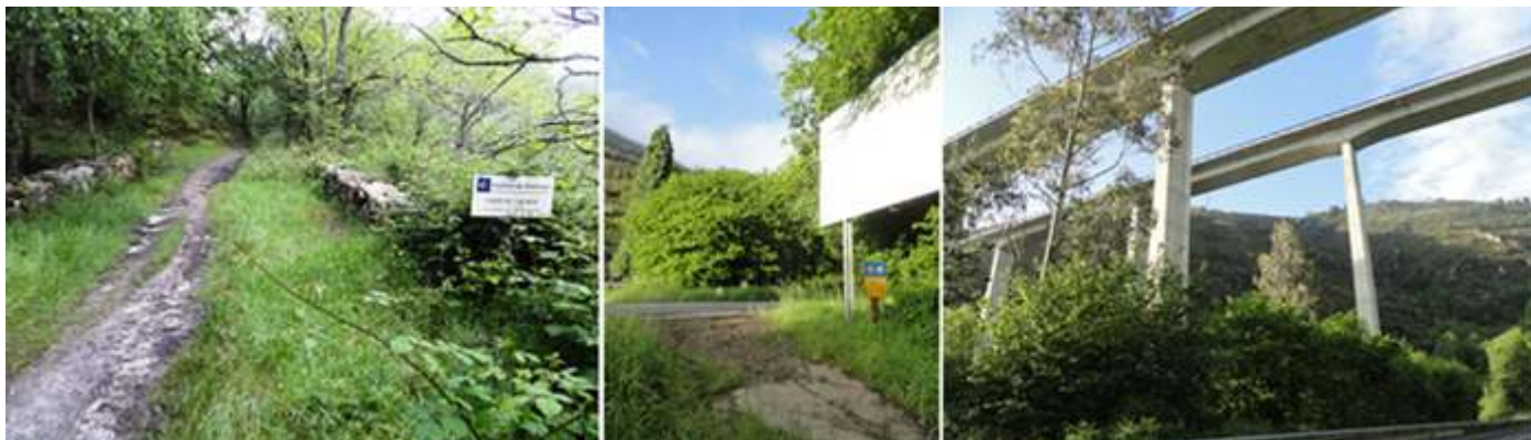
❶ Puente del Carcabón, construido entre los S. XVII-XVIII. ❷ Salimos del camino y alcanzamos la Ctra. N- 634. ❸ Pasamos bajos los puentes de la nueva autovía que transcurre elevada por encima.

Alcanzamos tras pasar el último puente y un fuerte repecho un poco más la Ctra. N-634, y por ella andaremos un tramo, en principio bajo las estructuras de la carretera que pasa por encima.