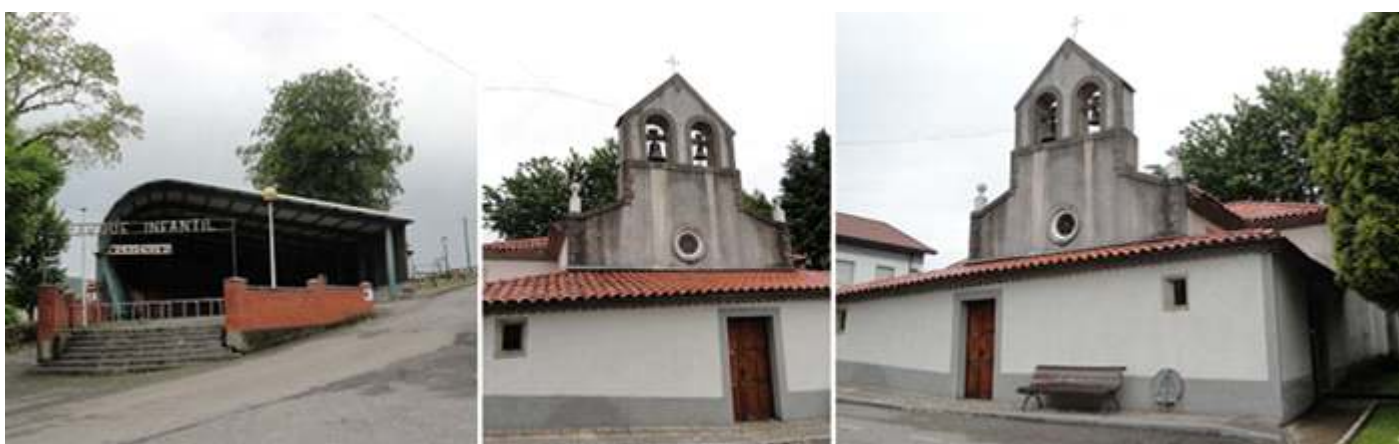
❹ Parque infantil en La Espina. ❺ La espadaña de la Iglesia de San Vicente, en esta localidad. ❻ Iglesia muy reformada en su exterior.

Recorremos el trazado por La Espina y su iglesia de San Vicente también encalada que solo dos deja ver su espadaña y con un óculo debajo. A unos 10 km no sale al Camino la localidad de La Pereda (del concejo de Tineo) y su capilla del Cristo de los Afligidos del S. XV.