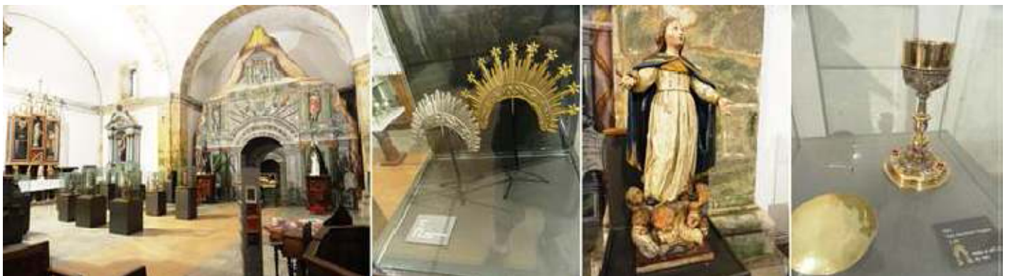
❶ Lateral del templo dedicado al museo. ❷ Coronas de Plata. ❸ Talla de la Virgen Inmaculada ❹ Cáliz de plata sobredorada del S. XVII.

El museo de Arte Sacro muestra una recopilación de los objetos y tallas que en otros tiempos estuvieron dedicados a la liturgia y culto, en iglesias y monasterios de la zona.