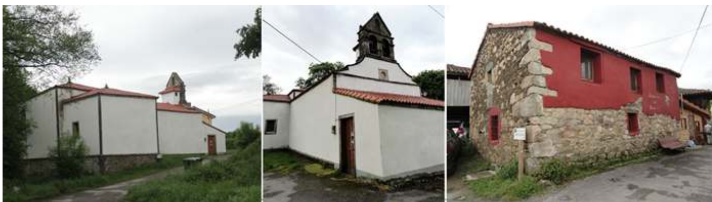
❶ Templo de Santa Marina con su cabecera recta. ❷ Y ante su fachada una construcción que solo deja ver su espadaña de tres vanos. ❸ Cobijo de Bordenalla

Pasamos la Iglesia de Santa Marina de Bordenalla, su albergue y su sencillo crucero junto al camposanto.. Y tras este cruzamos la ctra. N-634. Y nos encontraremos el segundo albergue de esta localidad.