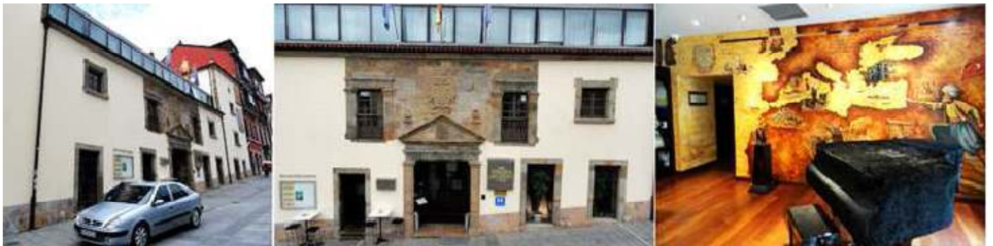
❶ Fachada a la calle Pio Cuervo. ❷ Frontal renacentista de este palacio. ❸ Interior del hall del hotel frente a su recepción.

Hoy convertido en un Hotel singular con todos los servicios dentro de este palacio totalmente reformado.