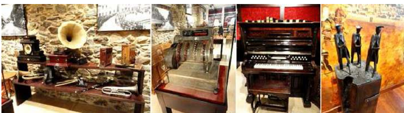
1 Otros objetos para oír música. 2 Una caja registradora. 3 Una pianola, con las partituras que ella misma tocaba sobre la tapa superior de la misma. 4 Escultura representando a un grupo de peregrinos.