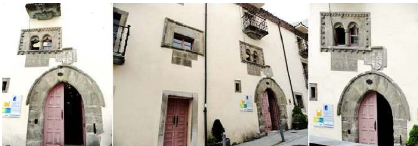
❶ Puerta del Palacio de los García, con un arco apuntado de dovelas lisas y un guardapolvo ❷ Cuenta con una amplia fachada que da a esta calle Mayor. ❸ Sobre la puerta dispone de los Escudos de los Tineo y los Maldonados.

Construido junto al Camino y casi a la vez que el convento de San Francisco, en estilo gótico y con una bonita fachada, y en la parte posterior conserva su torreón circular de comienzos del S. XIV.