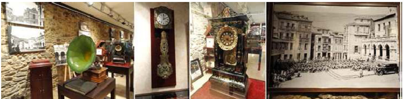
1 Objetos musicales. 2 Otro reloj de Pared. 3 Reloj sobre una consola. 4 Foto retrospectiva con una misa de campaña en la plaza de El Fontan ante el Ayuntamiento.

Objetos, todos en un estado perfecto de conservación, que se seguro es la paciente labor de un coleccionista a lo largo de los años.