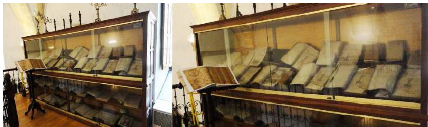
1 Vitrina con Libros, documentos, cantorales, etc. 2 En los aparadores que dispone el coro.