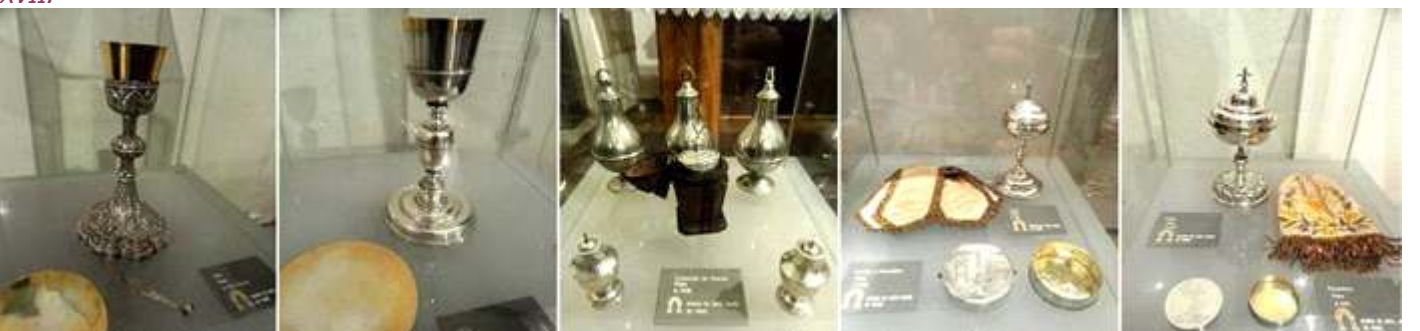
❶ Cáliz de plata de finales del S.XVIII. ❷ Cáliz de plata S. XVIII. ❸ Colección de Olieras del S. XVIII en plata. ❹ Arriba Copón de plata S. XIX y abajo Hostiaria o porta viático de plata S. XVIII. ❺ Copón y Porta viático de plata del S. XVIII.