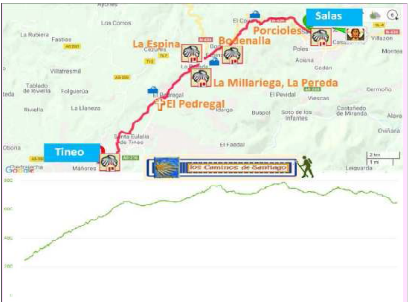
Itinerario y altitud. (Salas 225 m. Tineo 675m.)

http://loscaminosdesantiago.wordpress.com/