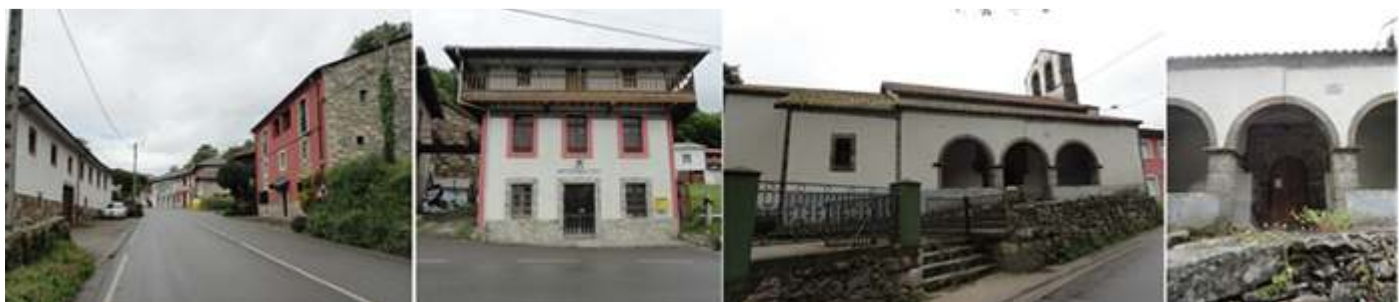
❶ Entramos en El Pedregal por a AS-216. ❷ Mantequería de Tineo. ❸ Iglesia de San Justo y Pastor de El Pedregal. ❹ Con un porche de tres arcos. Junto a la iglesia se alza una cruz de piedra que indica el Camino. Y llamado el Humilladero.

Seguimos hasta la AS-216 ya llegando a El Pedregal y su Iglesia de San Justo y Pastor