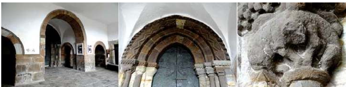
1 Detalle del pórtico interior con pequeños arcos en sus laterales. 2 Sus tres arquivoltas con un guardapolvo con decoración a Bolas. 3 Capitel exterior del lado izquierdo, se intuye una lucha de dos animales cuadrúpedos enfrentados.

Las arquivoltas descansan en impostas corridas, siendo las que hay en el lado izquierdo taqueado y las del derecho con puntas de diamante, y estas a su vez, en capiteles igualmente labrados con fustes sobre basas.