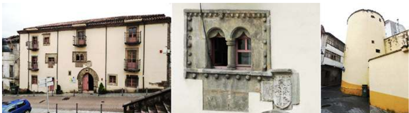
❶ Su Fachada gótico renacentista con varios balcones en sus plantas y ventanas decoradas. ❷ Su ventana geminada con dos arcos en los cuales dispone de cortinas talladas en los mismos. En uno de los escudos esta la fecha de construcción («Juan García de Tineo me fecit anno domini....XXX»). ❸ Si giramos a su parte posterior conserva un torreón circular defensivo de época bajo medieval. Con algunas ventanas saeteras.

Este palacio es una de las pocas muestras del gótico civil en Asturias y junto con el palacio Meras son las construcciones señoriales más notables.