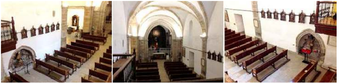
❶ Lateral de la nave del Evangelio vista desde el coro ❷ Las bóvedas de la nave con crucería simple que arrancan sus nervios desde las columnas rectas adosadas. ❸ Lateral del lado de la Epístola que posee igualmente un arcosolio que el lateral opuesto

Tras la visita de templo y sellar la credencial aprovechamos y vistamos el Museo.