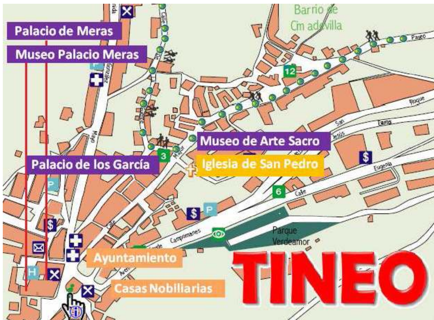
1 Croquis de Tineo con los emplazamientos más importantes.

los atendía la comunidad franciscana, de su castillo fue destruido los últimos restos a primeros del siglo pasado.