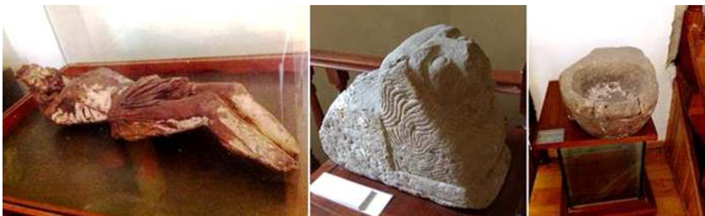
1 Talla de Cristo crucificado, al que le falta los brazos de finales del S. XII-XIII. 2 Efigie de León del antiguo Mausoleo de San Francisco del Monte. 3 Pila de agua bendita de piedra arenisca de taza plana algo fragmentada procedente de un templo y de ser encastrada en el muro.

Diferentes tallas de la Pasión de Cristo, Crucificado, con la Cruz, atado a la Columna, resucitado, Cruces procesionales, etc. de nuestro Redentor y Salvador.