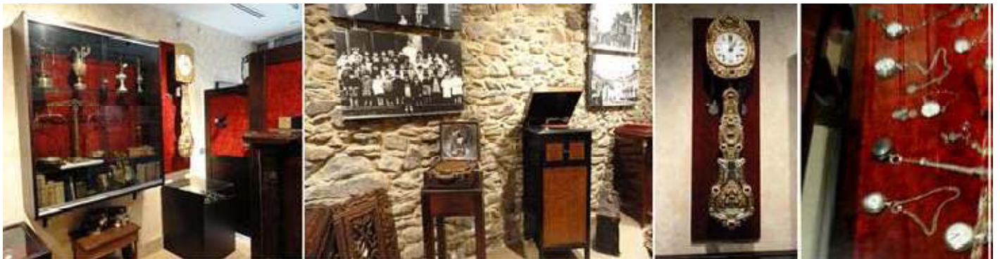
1 Vitrina con diferentes balanzas y libros. 2 Varios tocadiscos de mueble. 3 Otro reloj de pared con su péndulo profusamente repujado. 4 Vitrina con una colección de relojes de bolsillo.

Son piezas de la vida civil y de cuando la guerra. De lo más variado, pero destacan la colección de relojes de pared.