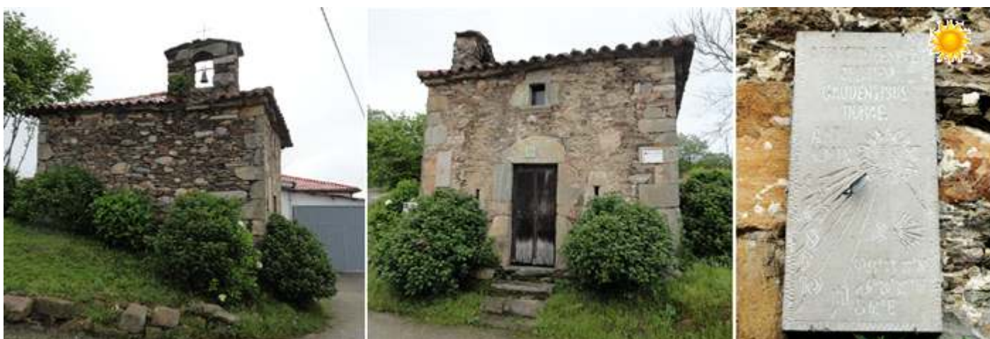
❶ En La Pereda la capilla del Cristo de los Afligidos. Construida con piedra irregular y con una pequeña espada en su lateral izquierdo. Esta perteneció a un antiguo hospital de peregrinos ❷ Reloj de Sol Tipo: vertical, rectangular. Con los números y horas excavados. Orientación al mediodía. Traza: de las 4 a las 12 h. p.m. en números arábigos. Gnomon de escuadra. Año:2009 Inscripción: Afelicitis lentae celeres gaudentibus horae. Y con las coordenadas también grabadas, además del la concha del camino y un sol. Esta junto a la ermita

La etapa discurre hasta aquí por caminos y carretera, pero un tramo que se mantiene inundado y con barro, lo que hay que tomarlo con paciencia, pensando, que unas regachas laterales lo que evitarían