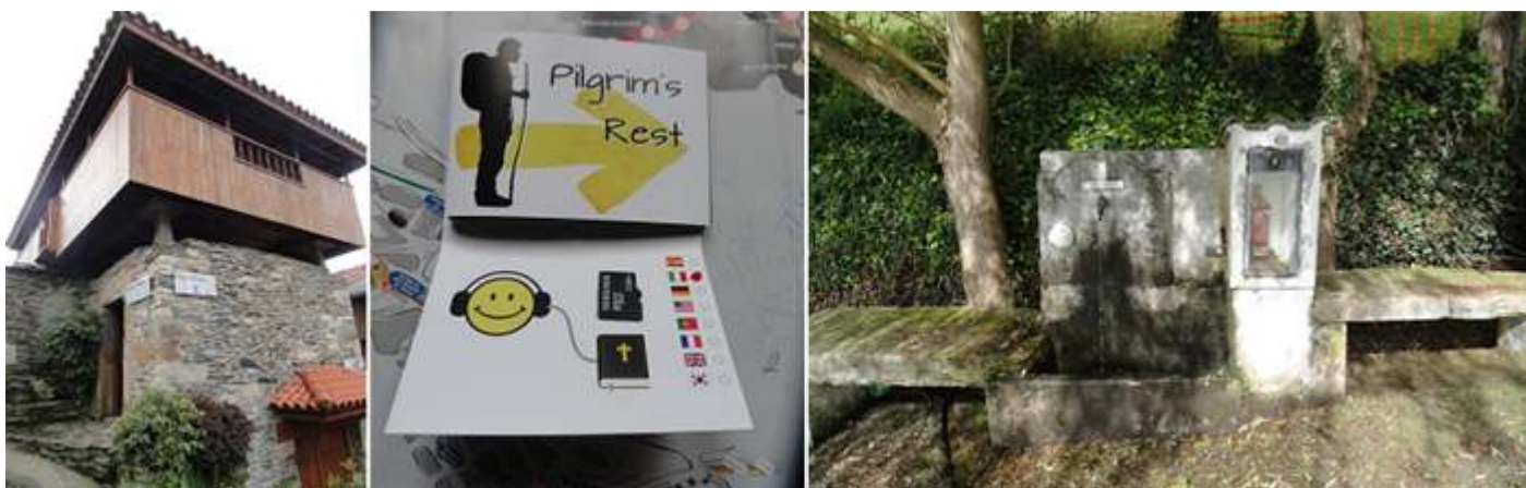
❶ Refugio El Espin a 725m. ❷ Con la curiosidad de encontrar entre la publicidad de los establecimientos próximos esta tarjetas de memoria en varios idiomas. ❸ Fuente de El Pedregal del S. XV-XVI, Con una hornacina con una imagen de Santiago. En esta zona es famosa por su embutido "chosco" con carne de cerdo, lengua y pimentón.

El Albergue de la Millariega a 257 km de Santiago y a 8km de Tineo.