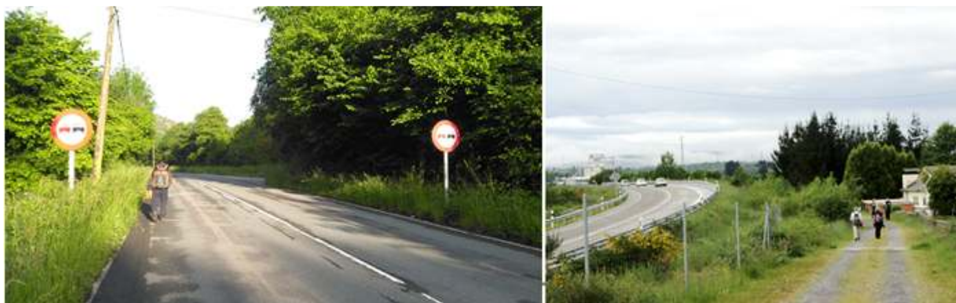
❶ Trascurso por la comodidad de la carretera.

Seguimos subiendo y salimos paralelos a la autovía, para llegar a Porcioles.