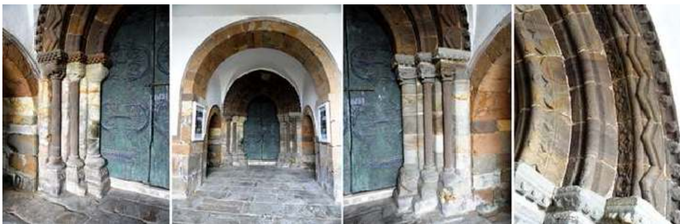
1 Columnas del lado izquierdo. 2 Su puerta dentro de un pórtico con arcos de medio punto. Las columnas de su lado derecho. 3 Detalle de la decoración de sus arquivoltas: la interior baquetonada y sobre ella tiene unas flores de cuatro pétalos, la siguientes con baquetón liso, 4 Y la exterior tiene una cenefa de flores su moldura baquetonada y sobre la misma una decoración en ziz-zag.

Templo de una sola nave, más la que se amplió posteriormente, con una capilla lateral.