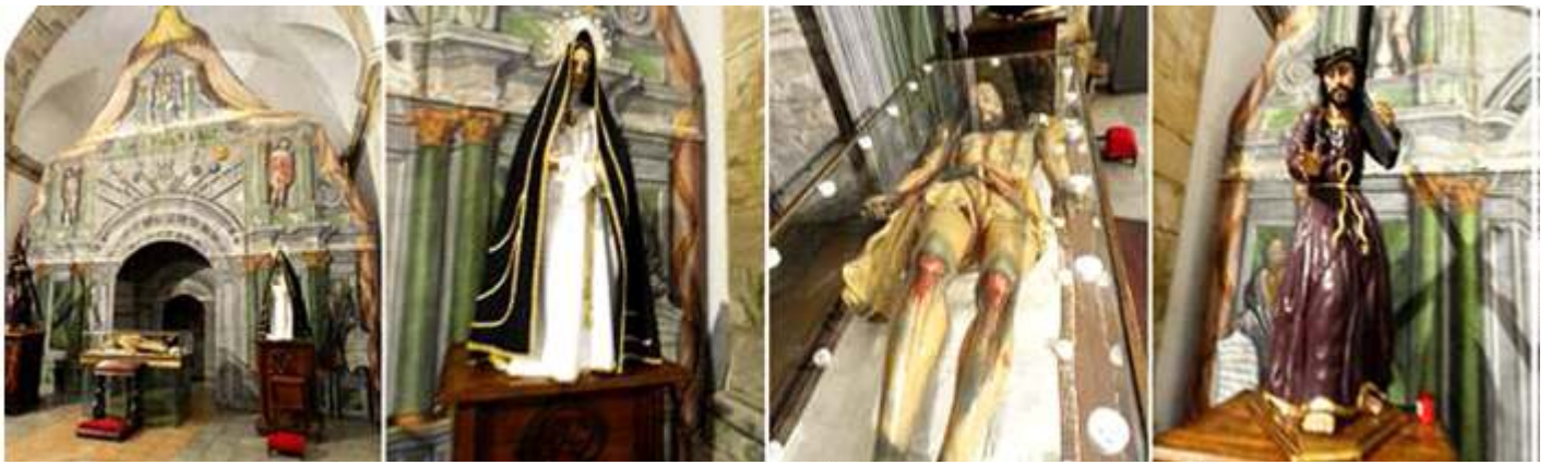
1 Monumento de Jueves Santo. 2 La Dolorosa. 3 Talla yacente de Jesucristo. 4 Jesús de nazareno con la cruz a cuestas