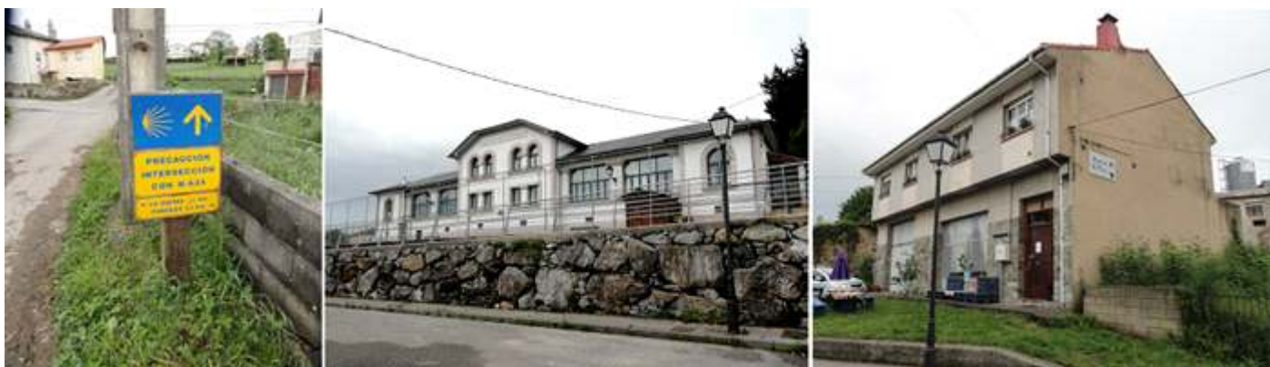
❶ Intersección con la N-634 a 3,5 de Porcioles. ❷ Las Escuelas junto al camino de La Espina. ❸ El Albergue El Texu, en La Espina.

Recorremos el trazado por La Espina y su iglesia de San Vicente también encalada que solo dos deja ver su espadaña y con un óculo debajo. A unos 10 km no sale al Camino la localidad de La Pereda (del concejo de Tineo) y su capilla del Cristo de los Afligidos del S. XV.