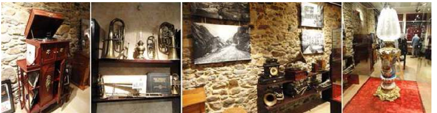
1 Mueble tocadiscos con discos. 2 Grupo de cornetas e instrumentos de viento. 3 Fotos y objetos de música. 4 Lámpara de porcelana, posiblemente de petróleo.

Objetos, todos en un estado perfecto de conservación, que se seguro es la paciente labor de un coleccionista a lo largo de los años.