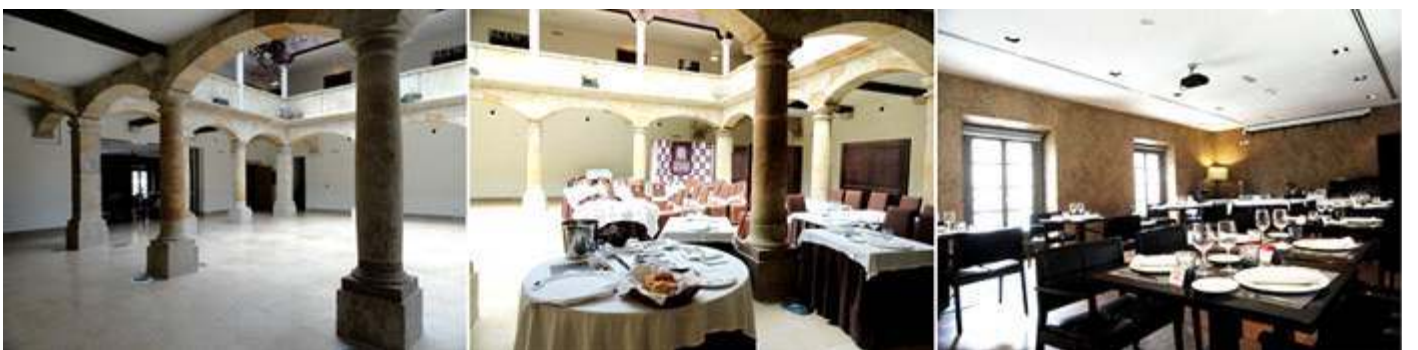
❶ Patio interior con arcos de piedra. ❷ Muy rebajados en la planta inferior y rectos de madera en la superior. ❸ Restaurante.

Dispone en su interior de un patio porticado de dos alturas.