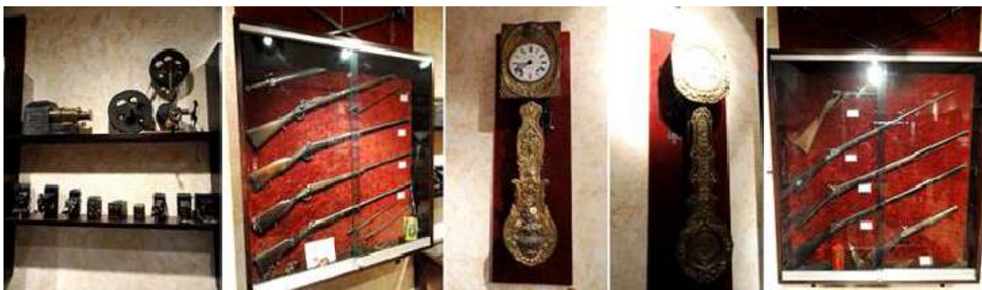
1 Cámaras de fotos, diapositivas, y cine. 2 Vitrina con escopetas y bayonetas. 3 - 4 Una pareja de relojes de pared. 5 Vitrina con armas de caza.

Su visita nos traslada a unos años. No muy lejanos en donde lo decorativo de los hogares era una señal de identidad de sus propietarios.