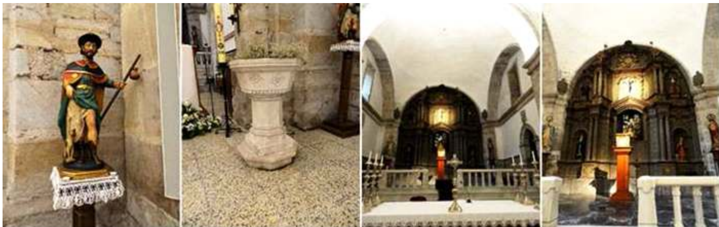
❶ Imagen de San Roque en el lado epistolar. ❷ Pila bautismal de mármol blanco con taza octogonal y bajo su borde cada faceta tiene una flor excavada, con un fuste de la misma sección con varios boceles y descansa sobre una basa cuadrada y esta sobre una octogonal, este junto al altar en lado de la Epístola. ❸ Capilla Mayor con un amplio presbiterio. ❹ La capilla con unas escaleras y cerrada con una balastrada de mármol.