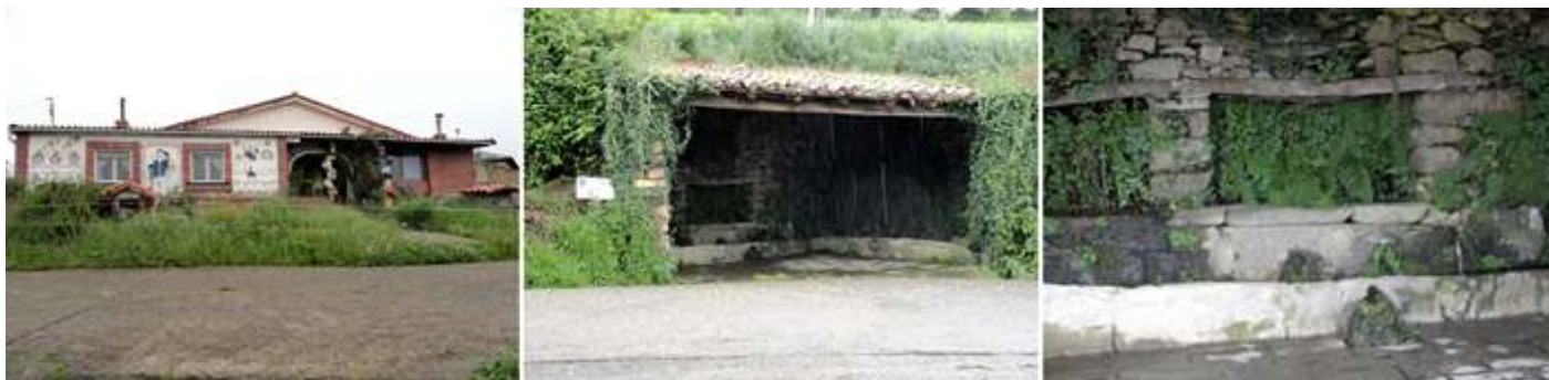
❶ Curiosa casa con decoración y "minero" incluido en su jardín. ❷ La Fuente de Recondo. ❸ Otra fuente a escasa distancia de la anterior.

En el transcurso de la etapa, aunque el día no está muy soleado nos proporciona algunos paisajes donde la naturaleza es la protagonista.