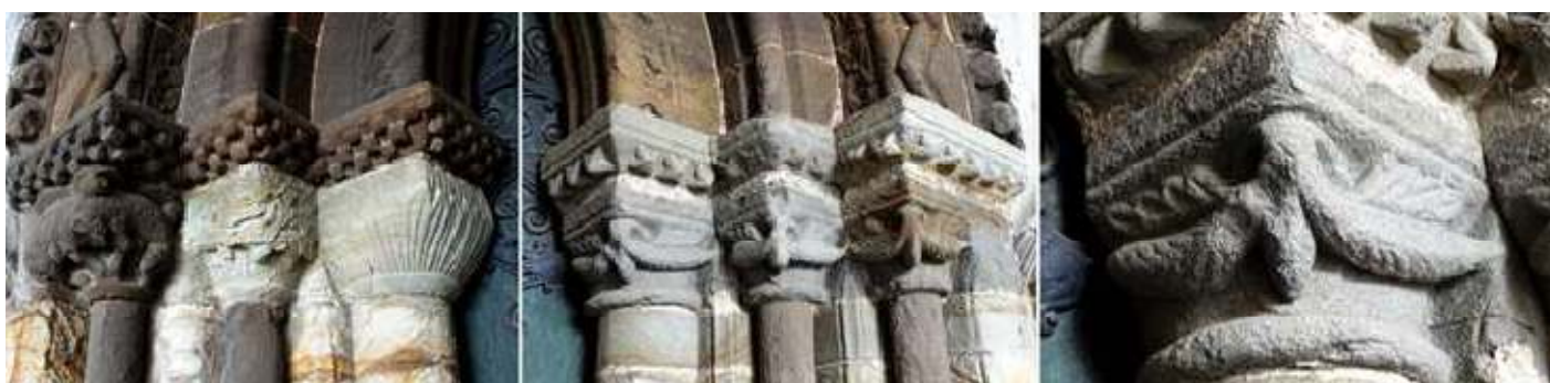
1 Lateral izquierdo con impostas de taqueado jaqués, capitel figurado otro con hojas de hiedra y con finas hojas el interior 2 En el lado opuesto los tres capiteles bajo las impostas con puntas de diamante de decoración muy similar de un conjunto vegetal de hojas de castaño. 3 Detalle del capitel interior.

Las arquivoltas descansan en impostas corridas, siendo las que hay en el lado izquierdo taqueado y las del derecho con puntas de diamante, y estas a su vez, en capiteles igualmente labrados con fustes sobre basas.