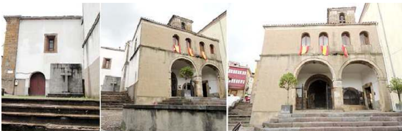
1 Lateral de la nave del lado del Evangelio, y con la puerta de Acceso al Museo Sacro, junto a una Cruz de Misión 2 El templo se asienta sobre un terreno aterrazado, junto a la calle Mayor y el paso del Camino. 3 Posee este pórtico de construcción posterior, al que posee en su interior.

Esta iglesia pertenecía al convento de los franciscanos, que viviendo los últimos años del rey Alfonso XI (1350) ya estaba fundado el convento, en el se hayan sepulturas de 1348. El templo parroquial está situado en la calle Mayor y rúa de los peregrinos, dispone ante su fachada principal, un amplio espacio y una grada de escaleras para salvar el desnivel de la calle