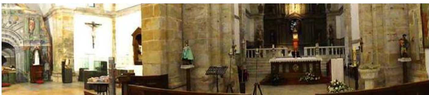
❶ Panorámica de la cabecera, y con la capilla de la Asunción que posee en su lateral del Evangelio y convertida en el Museo Sacro.