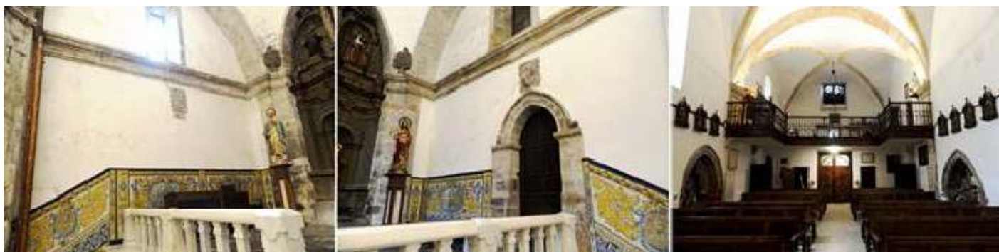
❶ Lateral del presbiterio izquierdo con un escudo y un zócalo con azulejos, ❷ El lado derecho con otro escudo sobre la puerta de la sacristía. ❸ Los dos últimos tramos de la nave con el coro elevado con galerías laterales de madera.

A ambos lados de la nave se encuentran sendos arcosolios de arco apuntado, posibles lugares de enterramiento con un Santo Cristo en el lado epistolar y una Virgen en el lado Del Evangelio.