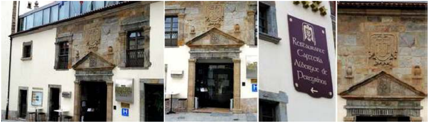
❶ Fachada del palacio con el fruto de la reconstrucción y convertirse en un hotel y albergue de peregrinos. ❷ Portada con dos columnas rectas estriadas lo mismo que el friso del frontis de sus entablamento y coronado con un frontis triangular donde se aloja su escudo nobiliario compuesto por una Cruz sobre la silueta de un águila con las alas desplegadas y en sus cuatro cuarteles unas manos con una inscripción. ❸ Rótulo del albergue. ❹ Sobre el frontis se encuentra otro escudo, este de Fernández de la Plaza con su bandera, alfanje y cinco cabezas de turco.

Hoy convertido en un Hotel singular con todos los servicios dentro de este palacio totalmente reformado.