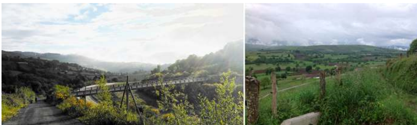
❶ El camino junto a la autovía y todo rodeado de vegetación.

En el transcurso de la etapa, aunque el día no está muy soleado nos proporciona algunos paisajes donde la naturaleza es la protagonista.