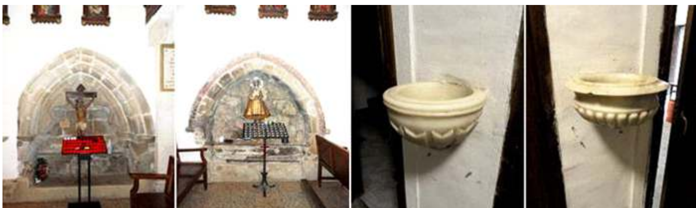
❶ Arcosolio baquetonado de arco apuntado que posee un Santo Cristo crucificado de los S. XVI- XVII. ❷ En el lado opuesto está la talla de la Virgen de Covadonga. ❸ - ❹ Pilas de agua bendita de mármol blanco situadas en la parte entrada.

A ambos lados de la nave se encuentran sendos arcosolios de arco apuntado, posibles lugares de enterramiento con un Santo Cristo en el lado epistolar y una Virgen en el lado Del Evangelio.