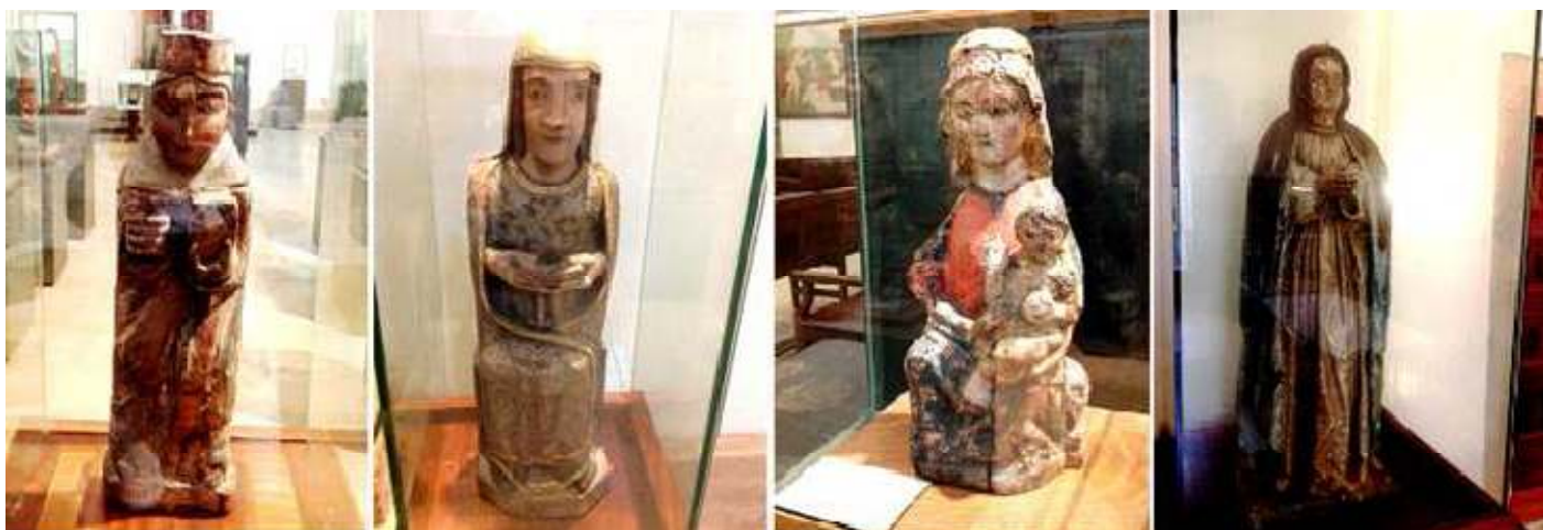
1 Virgen Edad Media. 2 Santa Ana S. XIV. 3 Virgen con el Niño S. XIII-XIV. 4 La Inmaculada.

A continuación hay una muestra de tallas de la Virgen.