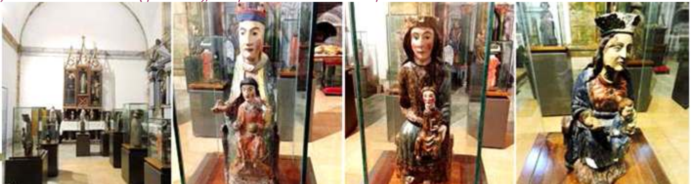
1 En este lateral hay una agrupación de talla policromadas de la Virgen. 2 Virgen de Bebares, talla policromada del S. XII 3 Virgen con el Niño S. XIII. 4 Virgen con el Niño del S. XV.