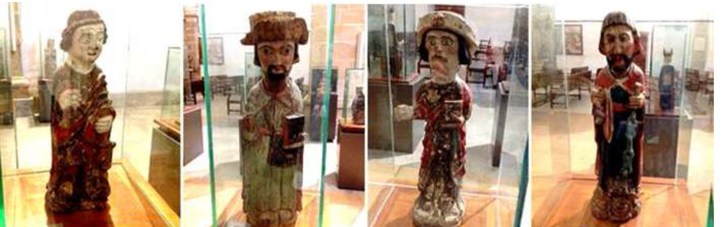
1 Arcángel San Miguel S. XIV. 2 Santiago Peregrino S. XV. 3 Santiago de peregrino en su mano derecha sostiene los Evangelios y en la derecha su bordón (que le falta), talla policromada del S. XV. 4 Apóstol San Bartolomé.

Interesante la colección de tallas de madera policromadas, de los S. XII al XV. Entre las que se encuentran dos del apóstol Santiago de peregrino.