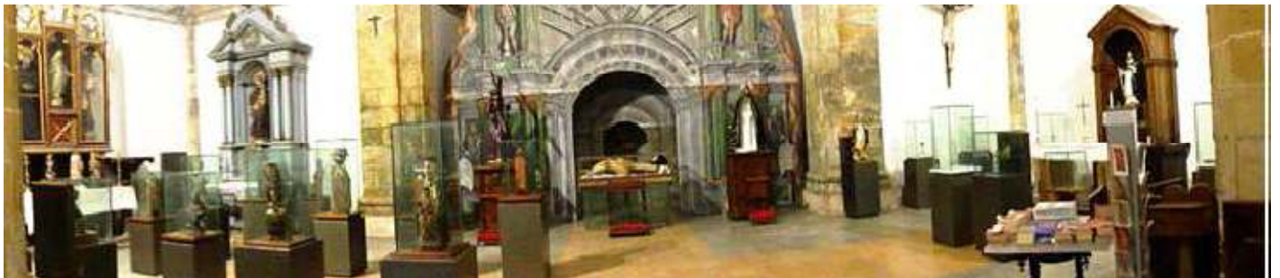
❶ Panorámica de parte de los objetos expuestos en el Museo. En la capilla construida en 1613 como funeraria de los Meras

Alojado en la capilla lateral del templo de los Medas, construida después del templo original por el capital Pedro Meras en 1613.