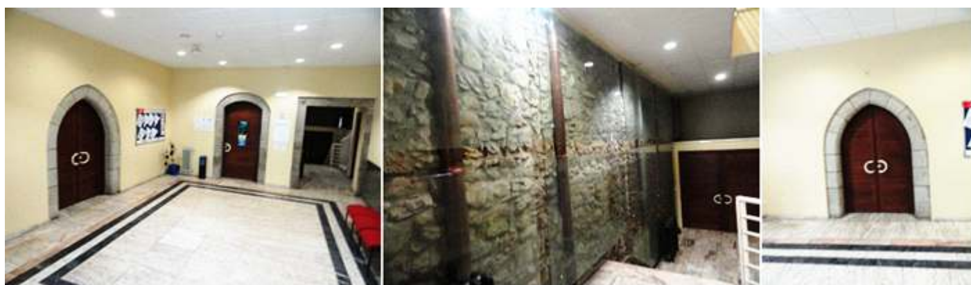
❶ Patio interior distribuidor. ❷ Posee unos lienzos de piedra vista. ❸ Puerta de arco apuntado.

En este edificio alberga la Casa de Cultura Conde de Campomanes y Biblioteca, es una construcción palacial de 1520 y que posterior tuvo una remodelación en el S. XVII