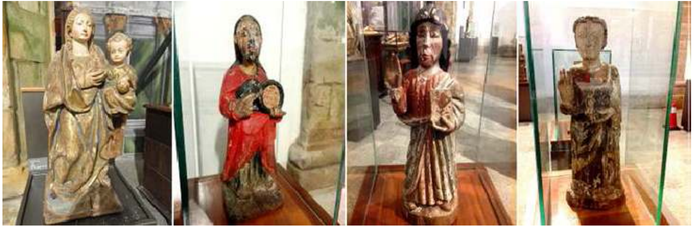
1 La Virgen con el Niño del S. XVI. 2 San Juan Evangelista S. XIV. 3 Talla de Cristo Salvador del S. XIII-XIV. 4 San Juan Evangelista S. XIII.

Interesante la colección de tallas de madera policromadas, de los S. XII al XV. Entre las que se encuentran dos del apóstol Santiago de peregrino.