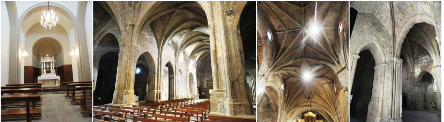
❶ Capilla de la Vera Cruz, la cruz de 20 x 18 está en un relicario de oro y plata del S. XVIII. ❷ - ❸ Detalle de las bóvedas de la nave central. ❹ Un detalle de las naves laterales.

En la capilla de la Vera Cruz, se encuentra uno de los fragmentos más grandes de la cruz donde murió Cristo "Lignun Crucis" los otros dos más mayores son los de París y Santo Toribio de Liébana, esta reliquia fue donada por Juan Fernández de Heredia. Próximamente se expondrá en el templo el cáliz del Compromiso, que desde la guerra estuvo guardado en una caja fuerte de una entidad bancaria. El templete donde se veneraba una reliquia de la Veracruz, donada por el Maestre Heredia que todavía se conserva.