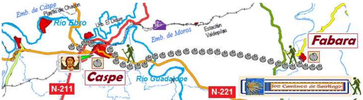
Itinerario y altitud. (Caspe 152 m. Fabara 244 m.) Plano empleado de la Web de la Diputación General de Aragón

Nada más salir cruzar la carretera, y se irá casi toda la etapa por la depresión de un barranco, hasta llegar al río Guadalope, después cruzaremos la A- 221, para en las inmediaciones de Caspe volverla a cruzar y entrar en la localidad, donde están las siluetas de un monumento a los peregrinos.