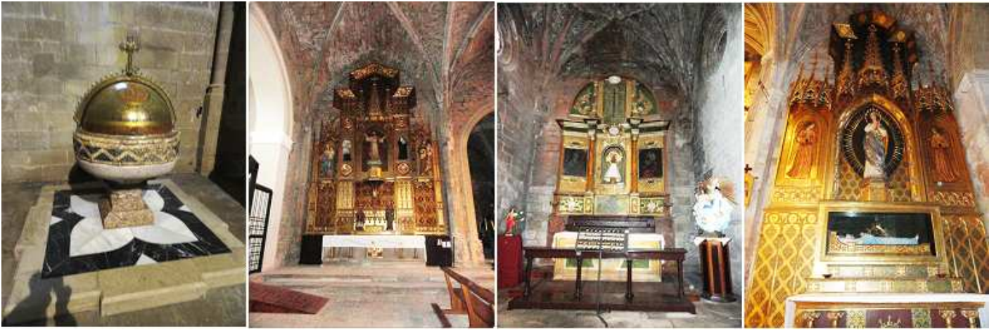
❶ En el lado de la epístola esta pila bautismal. ❷ Capilla del Sagrado Corazón. ❸ Capilla del Pilar. ❹ Capilla de la Inmaculada.

En la capilla de la Vera Cruz, se encuentra uno de los fragmentos más grandes de la cruz donde murió Cristo "Lignun Crucis" los otros dos más mayores son los de París y Santo Toribio de Liébana, esta reliquia fue donada por Juan Fernández de Heredia. Próximamente se expondrá en el templo el cáliz del Compromiso, que desde la guerra estuvo guardado en una caja fuerte de una entidad bancaria. El templete donde se veneraba una reliquia de la Veracruz, donada por el Maestre Heredia que todavía se conserva.