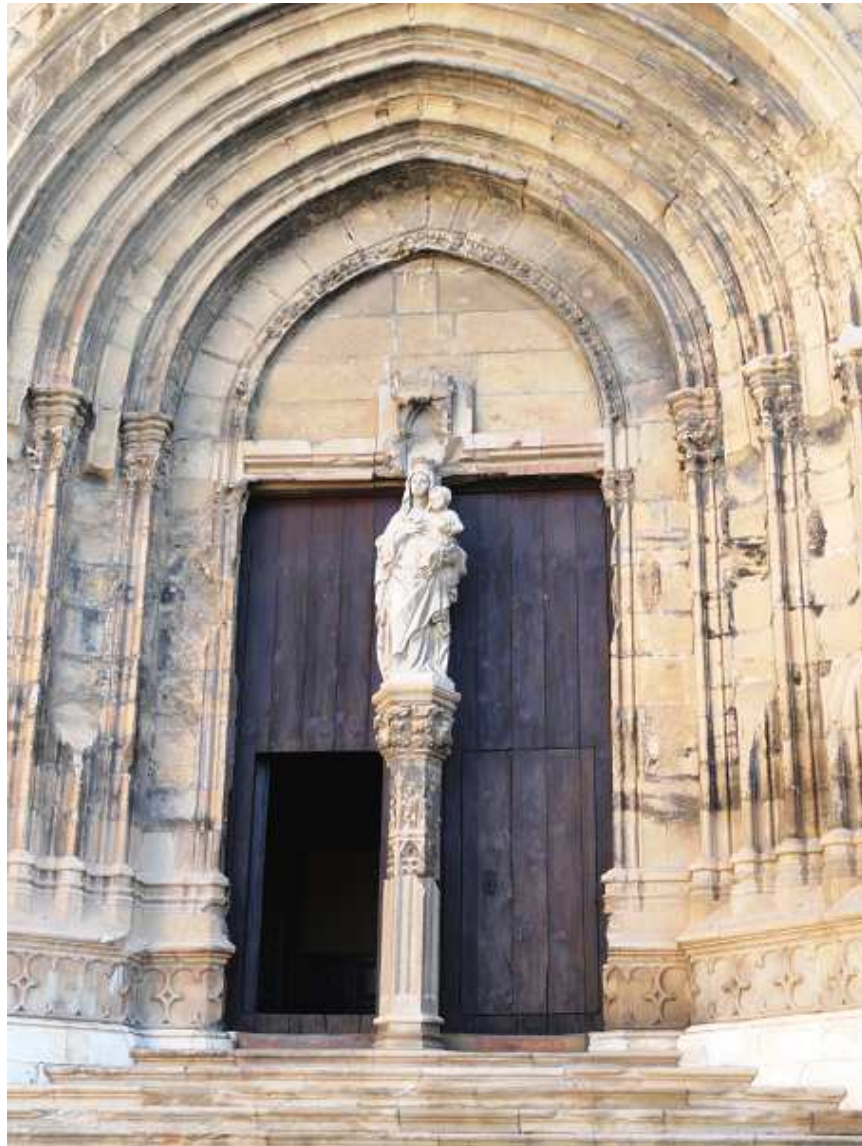
Portada de la Colegiata de Santa María en Caspe, S. XIV-XV