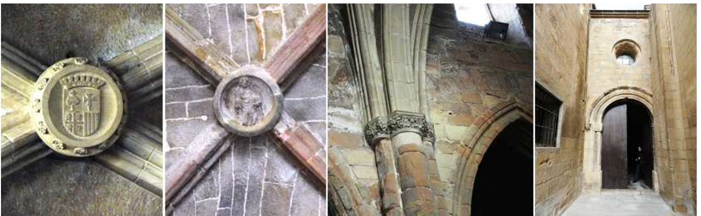
❶ - ❷ Clave del escudo del reino de Aragón en la nave central y otra clave de una nave lateral. ❸ Semi columnas adosadas donde descansan los arcos tajones y formeros. ❹ Tercera potada gótica en el lado de la epístola.

Tiene tres puertas: la principal o de la Virgen, la del Caritatero y la de San Antón. La torre, ubicada en el primer tramo de la nave lateral norte consta de dos cuerpos, el primero integrado por dos cuadrados de piedra y el segundo, cuadrado también, con aristas achaflanas en las esquinas y arcos de medio punto respondiendo al estilo neoclásico