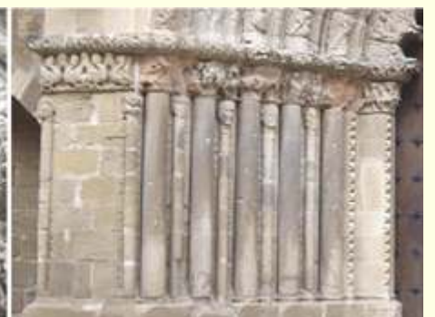
1 Puerta principal, lado epístola (existe otra puerta románica a los pies del templo) 2 Detalle de sus cinco arquivoltas. 3 Y los capiteles y columnas del lado izquierdo.