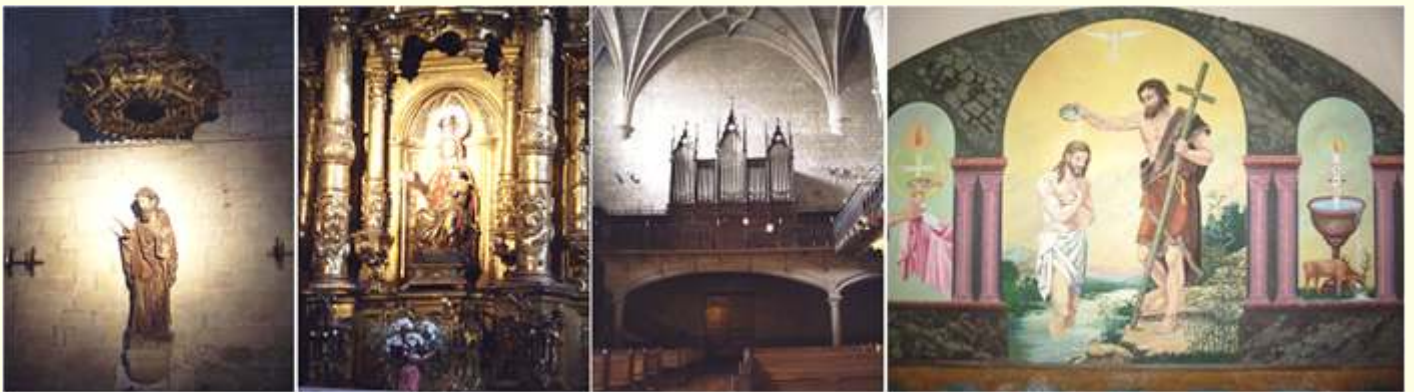
❶ Imagen de San Bartolomé. ❷ Camarín de la Virgen. ❸ Coro y órgano a los pies del templo. ❹ Mural del baptisterio bajo el coro elevado.

En las inmediaciones esta la iglesia de San Pedro,