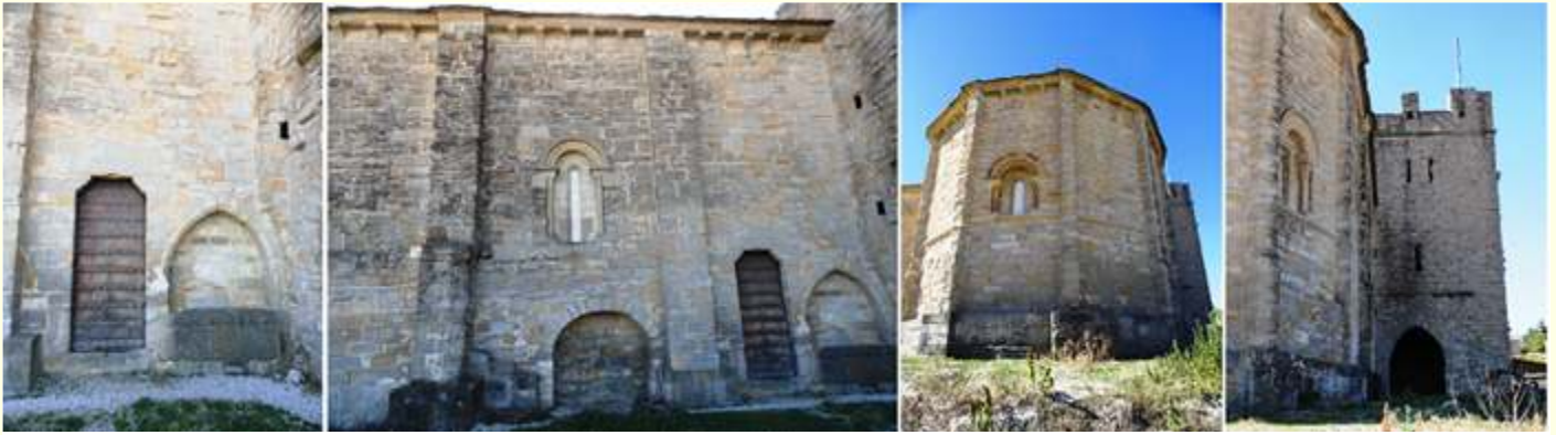
❶ Puerta recta que daba a claustro. ❷ Lateral exterior del Evangelio abierto con una ventana sendos arcosolios a los lados de la puerta. ❸ En el ábside entre contrafuertes un ventana con una arquivolta baquetonada con guarda lluvias, imposta y capiteles. ❹ Lateral de este lado y la torre.