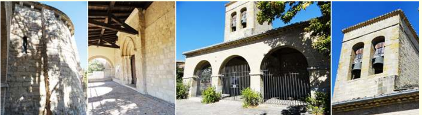
❶ Lateral del presbiterio exterior junto al porche. ❷ Este pórtico está cubierto con entramado de madera. ❸ El porche está cerrado con una verja. ❹ Dos ventanas de medio punto en el campanario con una imposta corrida sobre las mismas y cubierto a cuatro aguas con una cruz.

Su primitivo templo perteneció a la Orden Hospitalaria de San Juan de Jerusalén.