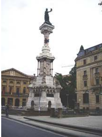
La Plaza de los Fueros