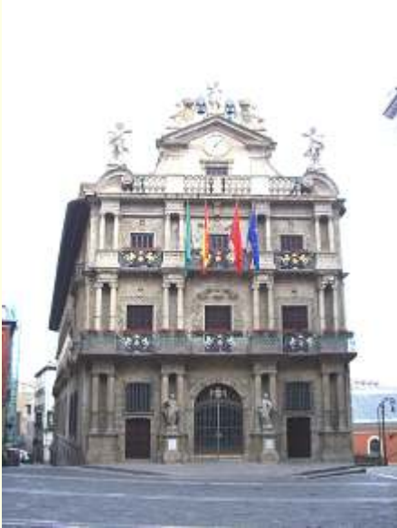
De nuevo el ayuntamiento... universidad

Salimos de Pamplona, por la hora estaba prácticamente desierta, no así los numerosos grupos de peregrinos, que se iban incorporando al camino.