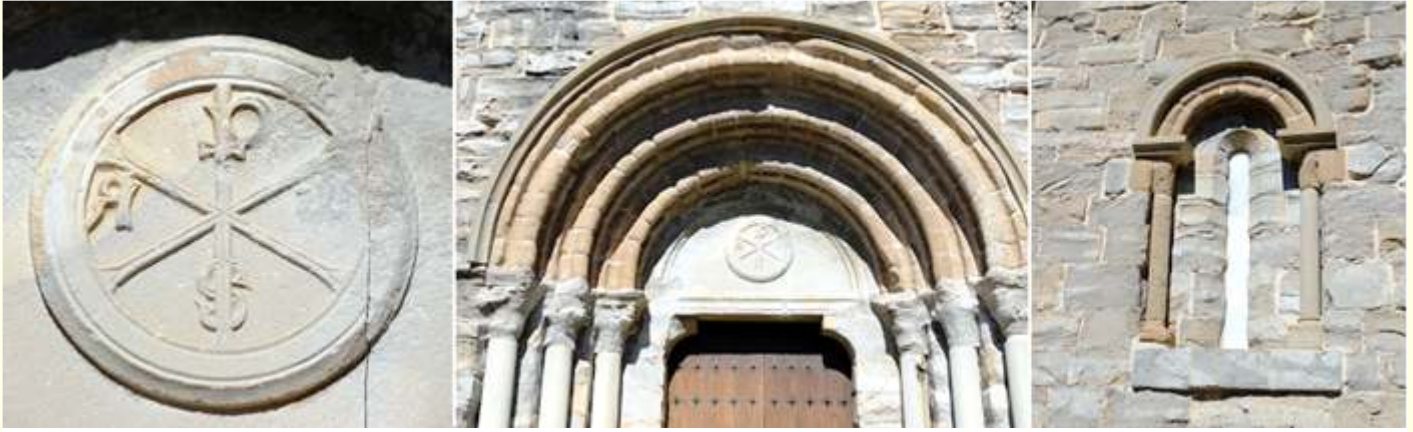
❶ Crismón trinitario tipo oscense de seis brazos, con tilde en el brazo de la P y las letras de A a Alfa y \Omega \omega Omega pendientes en sus brazos, con la S pisada, su exterior con un grueso aro. Situado sobre el tímpano de sus portada. y algo erosionado el símbolo omega. ❷ Detalle de la arquivoltas de la portada orientada al sur. ❸ Ventana del lado epistolar a la izquierda de la puerta.

constancia documental en los años 1250-1265 se le adicionó un claustro de planta pentagonal que desapareció.