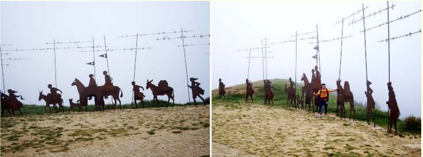
❶ Siluetas de metal en el Alto del Perdón ❷ En homenaje a los peregrinos, formado por varias siluetas de hierro que representan una peregrinación en caravana,

En el Alto del Perdón hay un monumento al peregrino y un impactante Parque Eólico.