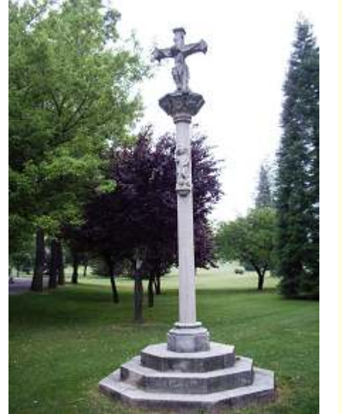
primer crucero a la salida junto la