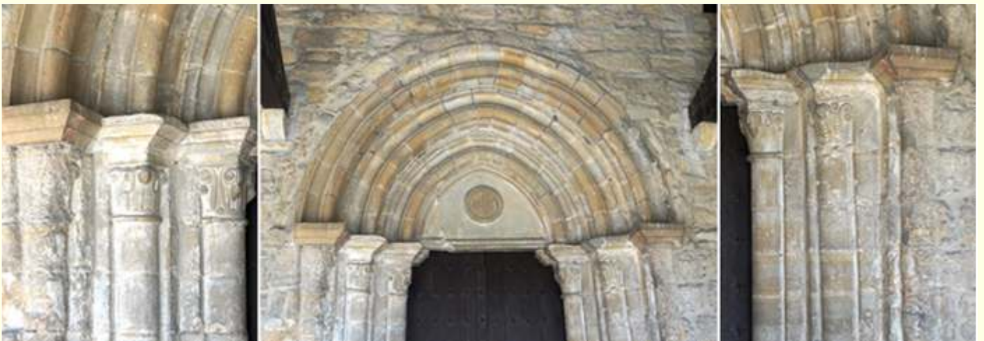
❶ Capiteles del lado izquierdo con motivos vegetales. ❷ Sus arquivoltas baquetonadas y en tímpano un crismón. ❸ Lado derecho..

Sobre su puerta ostenta un tímpano liso con un crismón trinitario.