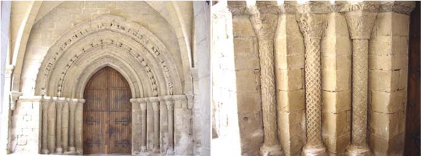
❶ Puerta románica de la Iglesia del Crucifijo S. XII. ❷ Detalle de las elaboradas columnas de la izquierda y sus capiteles

La primitiva iglesia fue construida en el siglo XII (hacia 1.146), en estilo románico. La actual iglesia es del siglo XV, pero conserva el pórtico románico de la antigua iglesia. Situada en el Camino de Santiago, pertenecía a la orden de los Templarios