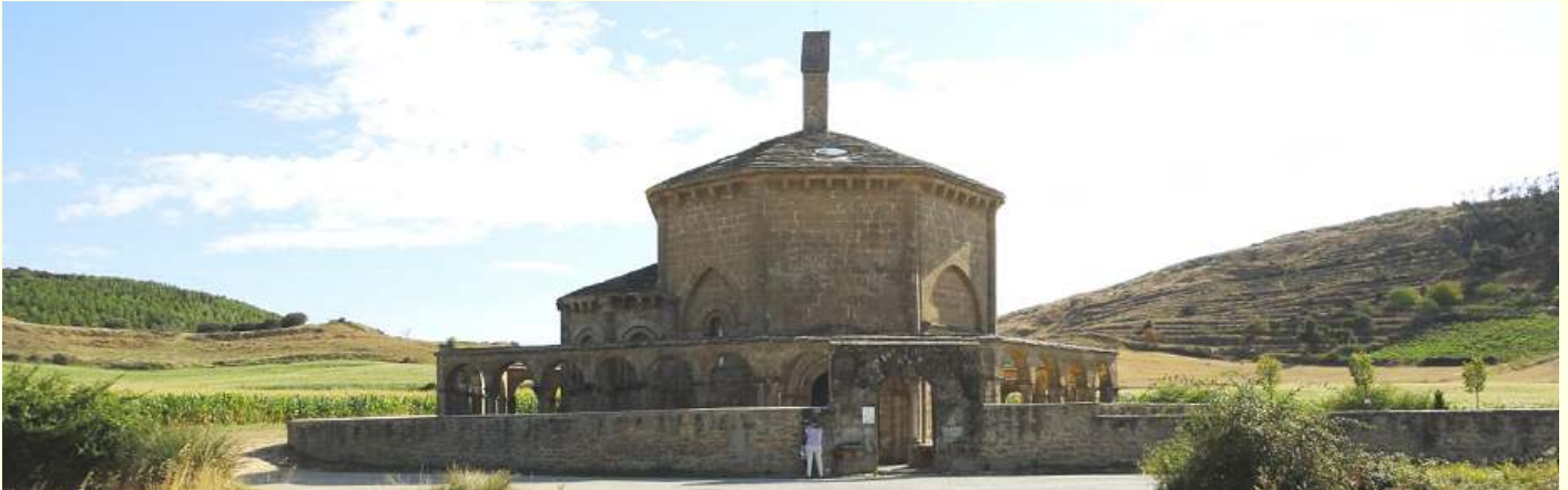
❶ Perspectiva desde su acceso a Santa María de Eunate.

Al pie del camino de desde Olcoz, donde se juntan el Camino francés y el aragonés en campo abierto está situada esta ermita románica construida en el S. XIII hacia 1170. En latín el término “eu nato” se traduce como bien nacido.