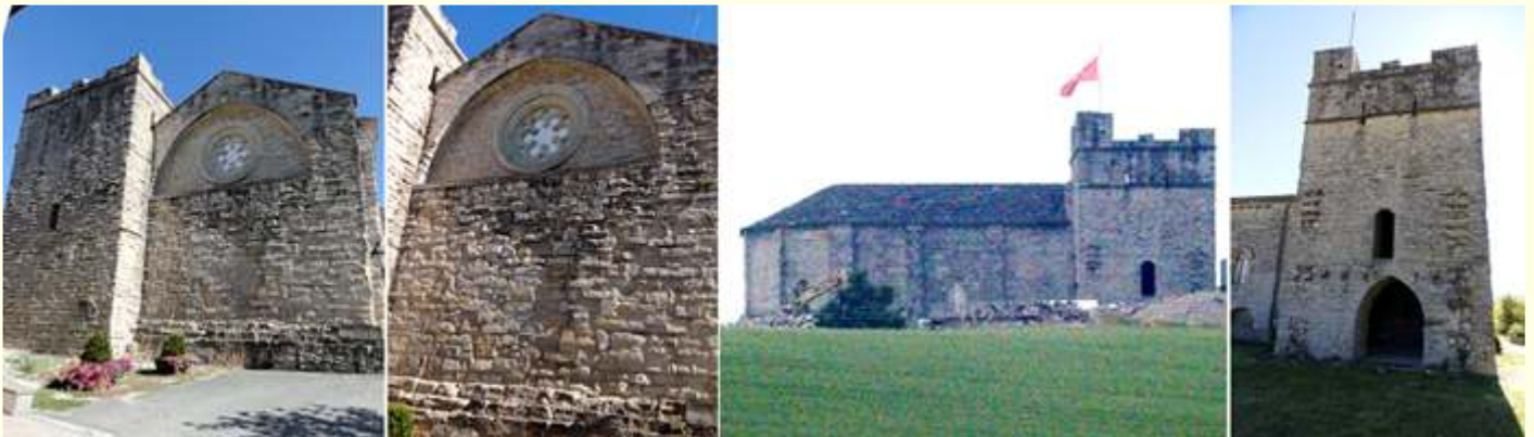
❶ Hastial y torre a los pies del templo. ❷ Un gran arco cobija este óculo. ❸ Silueta del templo llegando por el camino de Santiago. ❹ En esta cara la torre presenta una puerta apuntada, y sobre la misma otra de medio punto.

El templo fue restaurado por la institución Príncipe de Viana en 1989-90. Pero su piedra arenisca está muy degradada.