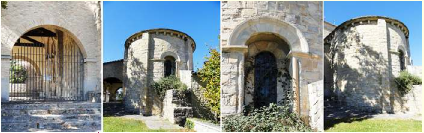
❶ Arco lateral del porche. ❷ Ábside con dos contrafuertes y una ventana. ❸ Esta ventana con guarda luvias que descansa en la imposta corrida y en las columnillas. ❹ Todo el alero del templo está con canecillos lisos curvos.

Su primitivo templo perteneció a la Orden Hospitalaria de San Juan de Jerusalén.