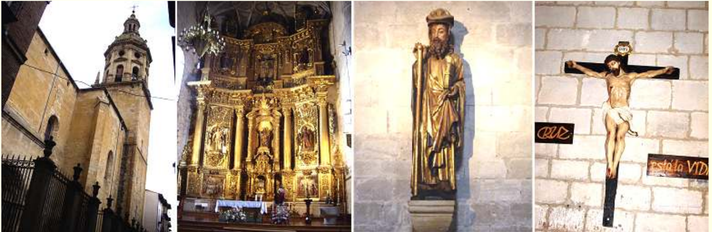
❶ Torre de la iglesia S. XVI. ❷ Retablo altar Mayor. ❸ Imagen de Santiago. ❹ Crucifijo bajo la arcada del coro.

Del primitivo templo solo se conservan sus dos portadas, la de los pies del templo y la del lado de la epístola. En el interior destaca el retablo mayor dedicado a Santiago, y adosados a los muros de la iglesia (una frente otra) destacan dos esculturas góticas de San Bartolomé, casi a tamaño natural, y la de Santiago "beltza" por su tono de la cara, además de su tamaño destaca por el tratamiento de sus ojos y cara.