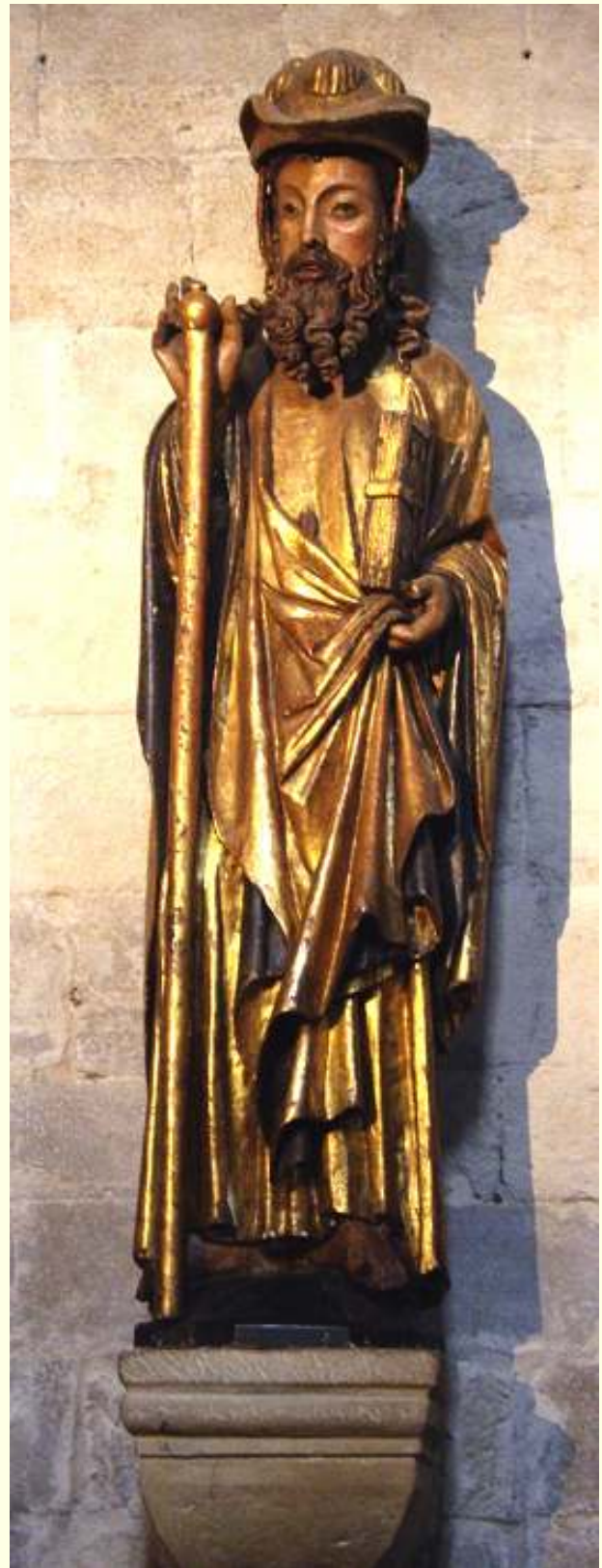
Imagen de Santiago en la iglesia de Santiago.

Espero te sea de utilidad esta información.