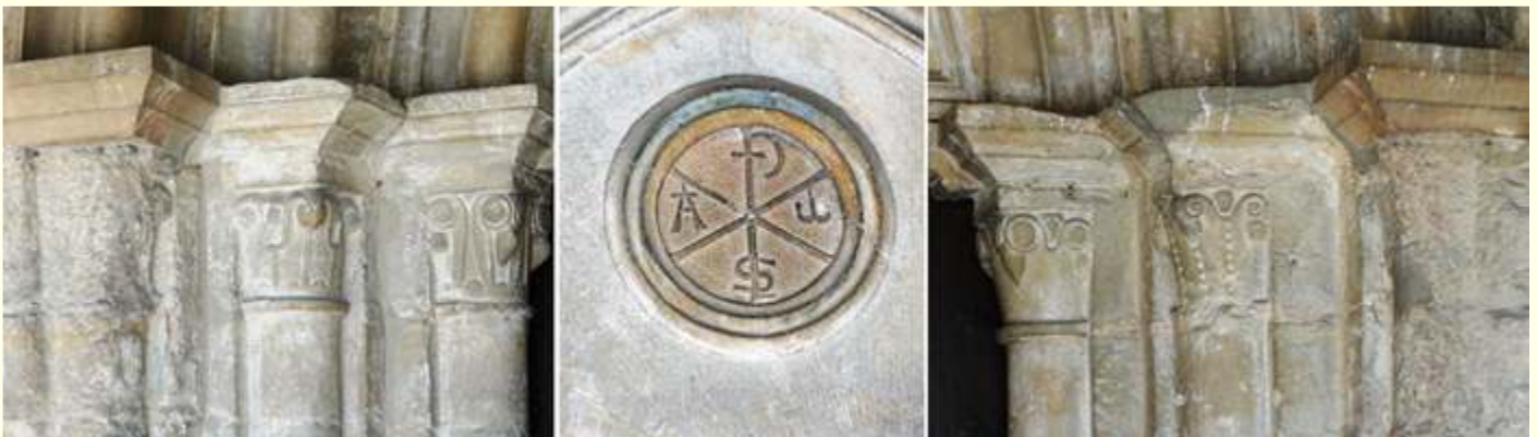
❶ Capiteles algo erosionados los exteriores, con decoración de hojas, piñas y palmetas. ❷ Crismón trinitario de seis brazos patados, en el vertical superior esta la P con tilde de cruz en los brazos superiores las letras de A a Alfa y \Omega \omega Omega pinjantes y en el inferior esta la S pisada con un latiguillo su brazo, dentro de un grueso aro biselado. ❸ En el lado derecho se repiten los motivos vegetales diferentes.

Sobre su puerta ostenta un tímpano liso con un crismón trinitario.