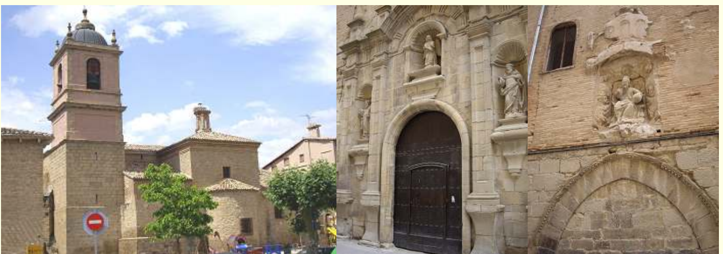
❶ Iglesia de San Pedro gótica S. XIV. ❷ Fachada del convento de la Trinidad renacentista S. XVII ❸ En la calle Mayor

En las inmediaciones esta la iglesia de San Pedro,