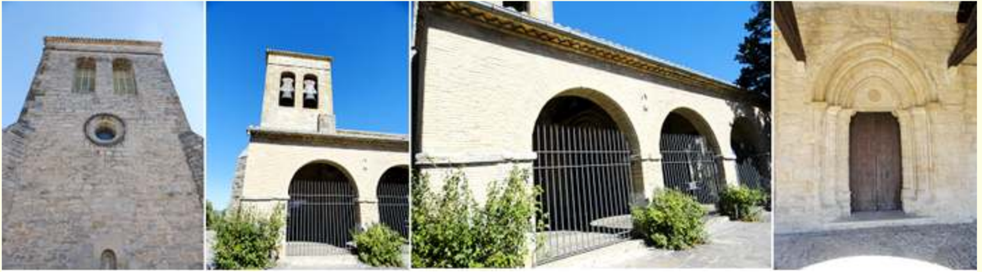
❶ Hastial del templo con un óculo y las ventanas del campanario. ❷ Su torre sobre el primer cuerpo con vanos abiertos al sur y al oeste. ❸ Pórtico construido en ladrillo con tres arcos. ❹ Su puerta de medio punto apuntada con tres arquivoltas.

Su interior compuesto por nave única de cuatro tramos que está cubierta con bóveda de cañón sobre arcos fajones, sobre columnas redondas adosadas con capiteles con motivos vegetales.