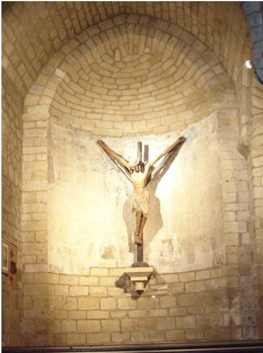
Iglesia del Crucifijo de Puente La Reina.