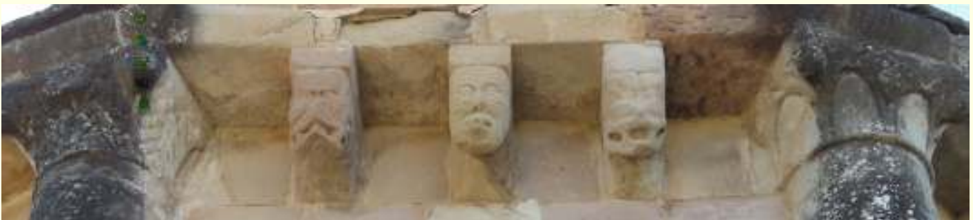
❶ Detalle de los canecillos de la cornisa, en el ábside de Santa María.

Parroquia de un despoblado, hospital de peregrinos, cementerio o lucernario, son las características que también se le atribuyen. En su pórtico con las tradicionales conchas indican que cumplió la función de iglesia cementerial.