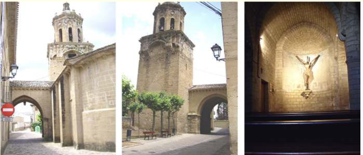
❶ Iglesia del Crucifijo con su torre ❷ Parte opuesta de la misma. ❸ Ábside con el crucifijo con sus brazos oblicuos.

La portada meridional es el único vestigio románico. Consta de tres arcos apuntados, que se sostienen por medio de las correspondientes columnas en cada lado, cuyos fustes y capiteles están tallados con temas vegetales, y en las arquivoltas encontramos cabezas humanas y distintas clases de animales, que junto con un ángel se entremezclan, su estado de conservación no facilita su detalle en las tallas.