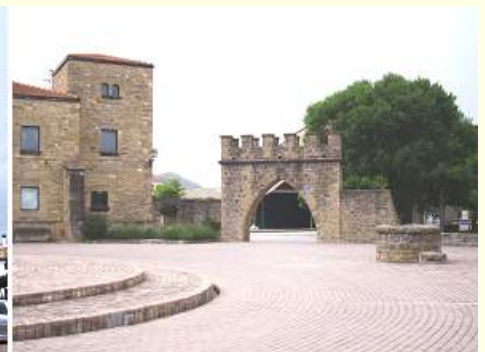
❶ Casa de Obanos nobiliaria. ❷ Porche de la iglesia parroquial San Juan Bautista en la plaza de los Fueros. ❸ Saliendo de la plaza.

Cuenta la leyenda que a la vuelta de Santiago como peregrina, Santa Felicia decide quedarse como eremita en Amocain. Su hermano Guillermo, duque de Aquitania, enojado ante la negativa de volver a la corte le da muerte. Arrepentido, vuelve a peregrinar a Santiago y a la vuelta se queda para siempre en Obanos, llorando su pecado hasta la muerte. Una estela al borde de la ermita de Arnotegui recuerda este hecho.