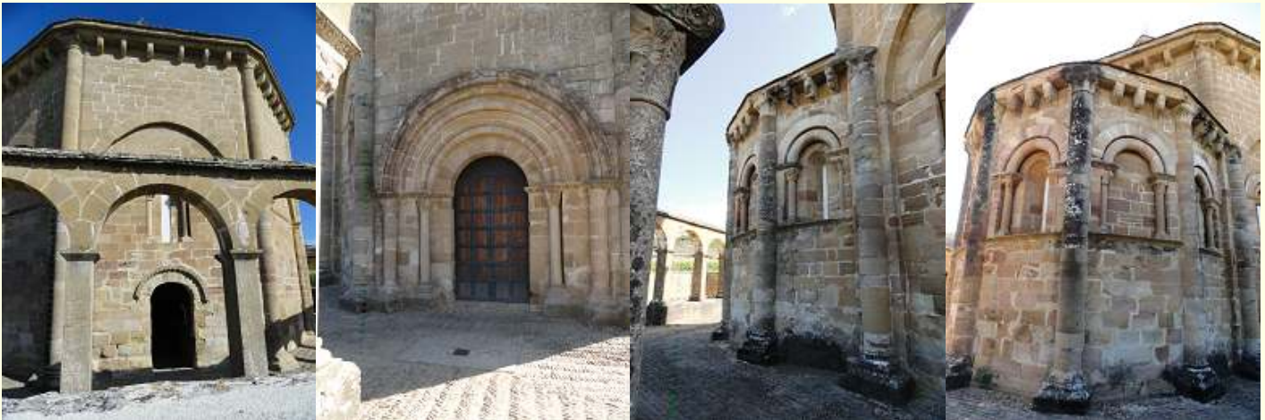
❶ Al oeste una sencilla puerta de ingreso cubierta con un guarda lluvias labrado con puntas de diamante. ❷ Puerta principal con cuatro arquivoltas, que descansan sobre dos pares de columnas a cada lado, abierta en su lado norte. ❸ Todo su contorno está rodeado por unas arcadas de planta octogonal. ❹ Otra imagen del ábside en su parte exterior de forma pentagonal con ventanas abiertas y ciegas.

Declarada como una de las joyas del patrimonio románico navarro y patrimonio nacional. Sobre su origen se especula sobre su pertenecía a la Orden militar y religiosa del Templo de Jerusalén, La Orden hospitalaria de San Juan de Jerusalén o la Cofradía de Santa María de Onat.