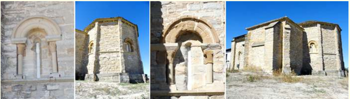
❶ Ventana del ábside lateral con capiteles con formas vegetales, ❷ Imagen de su cabecera y presbiterio. ❸ Ventana del presbiterio de las mismas características. ❹ Lateral epistolar con la sacristía en primer plano.

La Orden de San Juan llevo a Cizur en 1135, al recibir una donación de Lope Enecones y su esposa y se dedico a la atención de los peregrinos que marchaban a Compostela con un hospital, iglesia y monasterio.