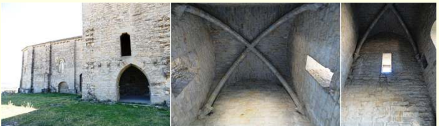
❶ Lateral exterior donde se encontraba en conjunto monástico y claustro. Este fue construido entre 1253 y 1262. ❷ Bóveda de cruceira en la torre sobre ménsulas sus nervios. ❸ Latorre se abre con finas ventanas aspilleras con derrame interior. ❹ Otra imagen del interior de la torre.

En la parte posterior del Evangelio está una de las torres que poseía este conjunto monástico.