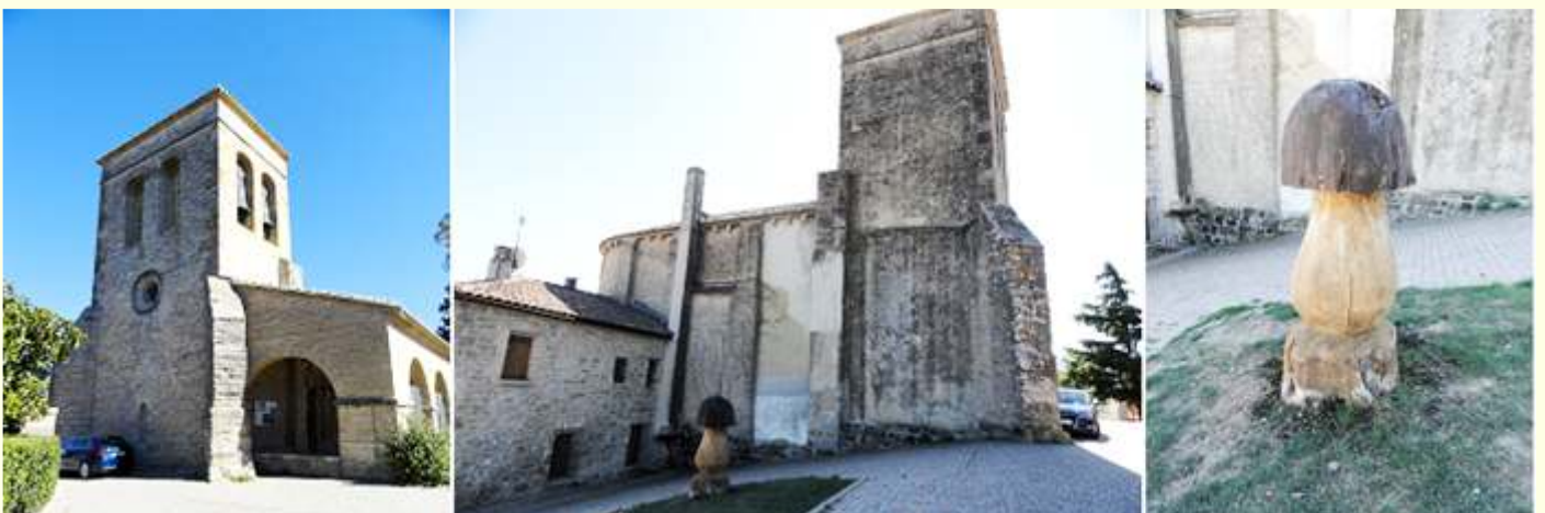
❶ Su torre de planta cuadra a los pies del templo, se levanto en el S. XVII. ❷ Lateral exterior del lado del Evangelio. ❸ En la placita que hay posterior al templo este boletus tallado en madera en el jardincillo.

Este templo del S. XII que ha sufrido importantes reformas en los siglos posteriores, todo su contorno bajo el alero dispone de canecillos lisos, y su cabecera su torre es del S. XVII. Posee un pórtico de ladrillo de construcción posterior con arcos de medio punto.